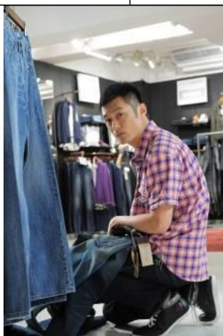
4. 余文樂在打理 Levi's®店期間，竟遇著奇怪顧客。