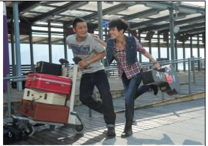
7. 余文樂及何韻詩一身「旅行 Look」拍攝以探索旅程為題的 Levi's®新廣告。