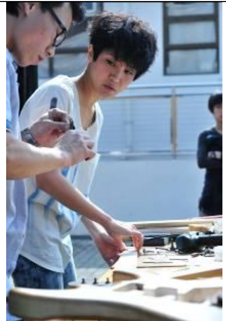
10. 何韻詩於宣傳廣告中首次學習自製結他。