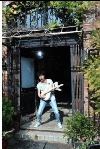
9. 何韻詩於手持自製的木結他，自得其樂。