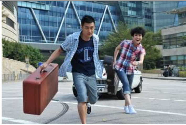
6. 余文樂及何韻詩一身「旅行 Look」拍攝以探索旅程為題的 Levi's®新廣告。