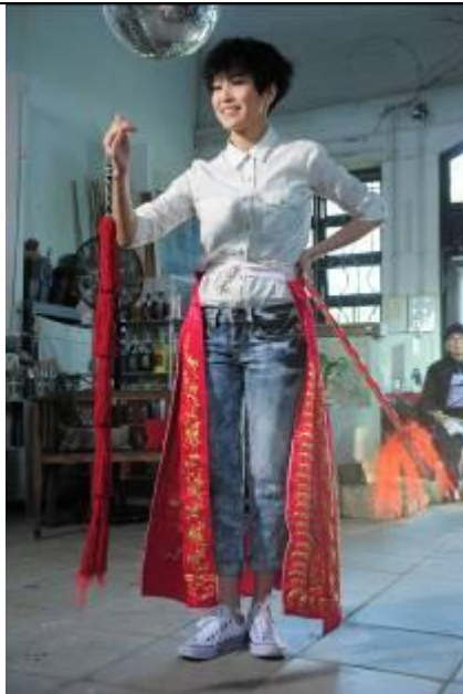
8. 何韻詩於宣傳廣告中挑戰從未接觸過的粵劇，勤練唱巧及造手