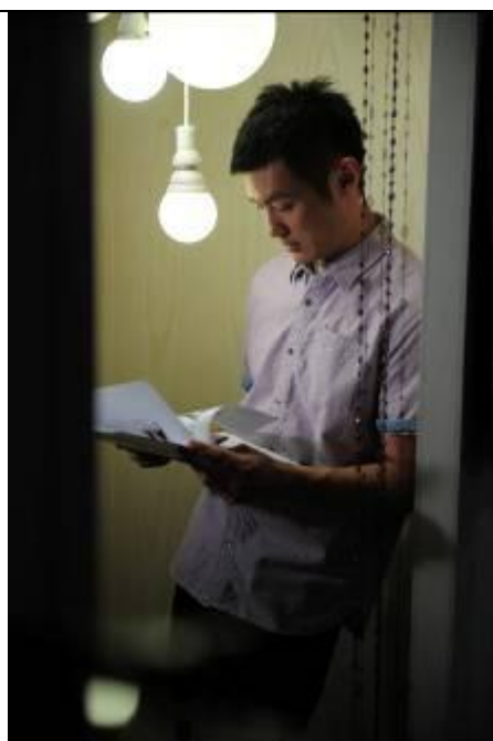
3. 宣傳廣告中余文樂挑戰打理 Levi's®店鋪任務，鏡頭外正勤力地「刨熟」貨品資料。