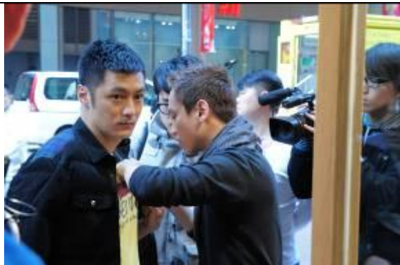
1. 余文樂為 Levi's®拍攝新廣告，整裝準備店內挑戰