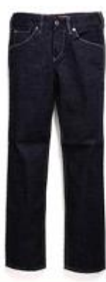
Rinse EU511-0049 $799