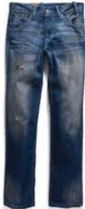
Doo Wop EU504-0046 $899