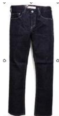
Rinse EU504-0027 $799