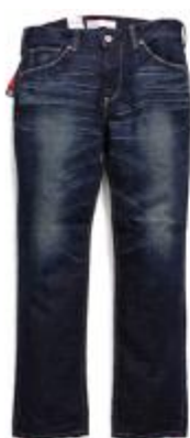
Dark Worn EU504-0028 $899