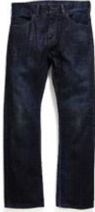
Shattered SQ523-0128 $699