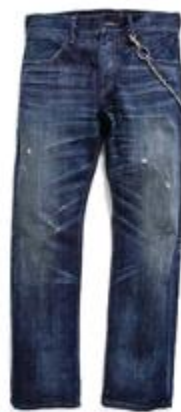
Heartbreak Hotel EU504-0056 $799