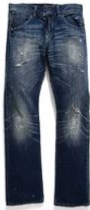
Les Paul EU511-0097 $899