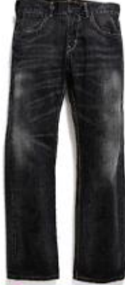
Vintage Black SQ522-0071 $799