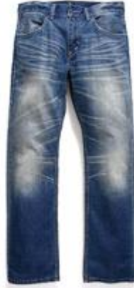
Visual Blue SQ523-0129 $799

同是 Levi's® Square Cut Jeans 的家族成員之一，SQ522 是繼 EU511 剪裁後最窄的型號。黑色懷舊洗水配合窄身剪裁，更具英倫風格。